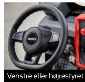
Venstre eller højrestyret