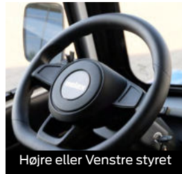
Højre eller Venstre styret