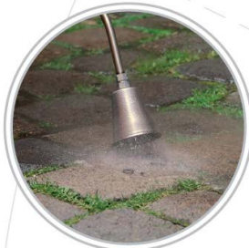
Termosfærisk keglelanse Kan behandle med både 5 og 10 ltr. vandforbrug i minuttet